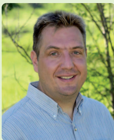
Christophe Pomez , président du groupe des élus Verts